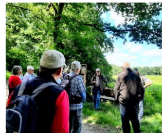
Info-Pause bei einer Bellmann- Gedenktafel