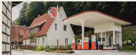
Ansicht der Königsberger Straße

Die Exkursion zur Freilichtausstellung „Königsberger Straße - Heimat in der jungen Bundesrepublik“ im Museum am Kiekeberg gibt einen Eindruck vom Leben in der jungen Bundesrepublik zwischen 1945 und 1970. Treffpunkt: 10.00 Uhr am Bahnhof. Die gemeinsame Anreise erfolgt mit Kleinbussen bzw. Fahrgemeinschaften. Nach der Ankunft folgt eine Führung durch die Bauten. Danach besteht die Möglichkeit für ein Mittagessen im Museumsgasthof „Stoof Mudders Kroog“ auf eigene Kosten und die Besichtigung der anderen Objekte. Rückkehr gegen 15.00 Uhr. Teilnehmerbeitrag 10,- (Vereinsmitglieder), 15,- € (Nichtmitglieder), Sonderpreis 5,- € für Kinder bis 12 Jahre.