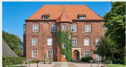
Das Schloss Agathenburg

Tagestour zum Schloss Agathenburg, Treffpunkt: 13.00 Uhr am Bahnhof Buxtehude, gemeinsame Anreise mit der S-Bahn. Nach der Ankunft folgt eine Führung durch das Schloss. Anschließend genießen wir die im Preis enthaltene gemeinsame Kaffeetafel im Schloss. Rückkehr gegen 17.30 Uhr. Teilnehmerbeitrag 10,- € für Vereinsmitglieder, 15,- € für Nichtmitglieder, Sonderpreis 5,- € für Kinder bis 12 Jahre.