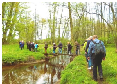
Ein schmaler Steg führt über den Staersbach

Zurück nach Moisburg geht es auf der Ostseite der Este. Nach einem Kiefern- und Tannenwald überqueren wir zunächst die feuchten Wiesen auf einem Holzsteg und wandern dann weiter auf einem schmalen Weg nach Moisburg zurück.