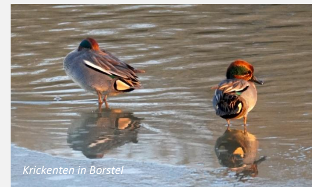
Krickenten in Borstel

Wenn vorhanden, bitte ein Fernglas mitbringen. Fußgänger*innen wird die Möglichkeit einer Mitfahrgelegenheit gegeben. Die Führungen sind kostenlos. Treffpunkt ist auch für die Früh Touren der Schafmarkt.