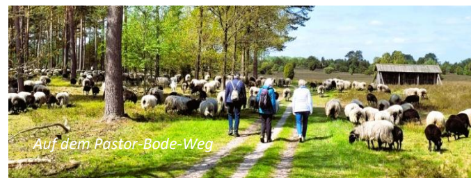
Auf dem Pastor-Bode-Weg

Leitung: Rüdiger Maack Rundweg Undeloh – Wilsede – Undeloh Weglänge: 11 km, Einkehr: Hotel zum Heidemuseum Start/Ziel: Wanderparkplatz in Undeloh, Wilseder Straße, gegenüber dem Heide-Erlebniszentrum Tourencharakter: die Wanderung führt von Undeloh auf dem Pastor-Bode-Weg durch das schöne Radenbachtal nach Wilsede, Einkehr im Hotel zum Heidemuseum. Wer möchte, kann das Heidemuseum besuchen. Nach der Pause geht es zu Hannibals Grab und dann zurück nach Undeloh.