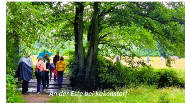
An der Este bei Kakenstorf

Leitung: Rüdiger Maack Rundweg Bötersheim – Kakenstorf – Bötersheim Weglänge: 9 km, Einkehr: Landgasthof zum Estetal, Kakenstorf Start/Ziel: Bötersheim, Esteweg, bei der 1000jährigen Eiche Tourencharakter: In Bötersheim sind schöne alte Häuser mit bunten Gärten unter stattlichen Bäumen zu bewundern. Der Ort ist vom Gutshof geprägt, den es hier schon seit dem Mittelalter gibt. Der Hinweg nach Kakenstorf führt fast immer durch Mischwald direkt an der Este entlang. Moorbereiche wechseln sich mit Heide- und Moosflächen ab. Hier war im 19. Jahrhundert der legendäre Wilddieb Hans Eidig auf der Pirsch. Unser Zielort Kakenstorf (1105 erstmals erwähnt) hat ebenfalls einen alten Ortskern. Zurück geht es auf Feld- und Waldwegen durch Kiefern- und Mischwald und über Wiesen.