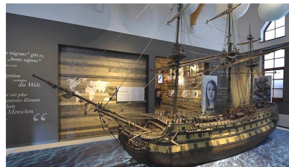
Das Auswanderermuseum zeigt die Geschichte der europäischen Massenauswanderung

18. Oktober, 10.00 Uhr: Ballinstadt - Auswanderermuseum In drei rekonstruierten Gebäudepavillons erzählt die Ausstellung die Geschichte der europäischen Massenauswanderung im späten 19. und frühen 20. Jahrhundert. Sie beschreibt das Leben der Menschen in der Auswandererstadt, ihre Flucht, ihr Leid und Elend. Sie berichtet aber auch von den Hoffnungen und Träumen der Emigranten auf ein besseres Leben in der neuen Heimat. Treffpunkt: 10:15 Uhr am Bahnhof Buxtehude , gemeinsame Anreise mit der S-Bahn. Nach der Ankunft erfolgt ein Einführungsvortrag. Danach besteht die Möglichkeit für ein Mittagessen auf eigene Kosten, bevor ein kommentierter Rundgang durch die Ausstellung folgt. Rückkehr gegen 15:30 Uhr. Teilnehmerbeitrag 10,- € für Vereinsmitglieder, 15,- € für Nichtmitglieder, Sonderpreis 5,- € für Kinder bis 12 Jahre.