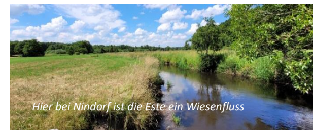
Hier bei Nindorf ist die Este ein Wiesenfluss

Leitung: Marlis und Hans-Joachim Dammann Rundweg Kirche Moisburg – über die Geest zum Butterberg – Daensen zur Einkehr – durch das Estetal zurück nach Moisburg Weglänge: ca. 8 km, Einkehr: Restaurant Merrano in Daensen Start/Ziel: Parkplatz „Bei der Kirche“ in Moisburg Tourencharakter: Die Wanderung beginnt bei der mittelalterlichen Kirche in Moisburg und führt durch den Ort weiter auf dem Alten Postweg über die Geest zum Golfplatzgelände mit dem 50 Meter hohen Butterberg. Von dort geht es nach Daensen, wo auf dem Golf-Hof im Restaurant Merrano eine Pause eingelegt wird. Der Rückweg führt auf dem Estewanderweg an Wiesen und Fischteichen vorbei zurück nach Moisburg.