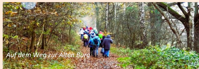
Auf dem Weg zur Alten Burg

Leitung: Prof. Werner Alpers, Karin Thomas Rundweg Hollenstedt - Alte Burg - alter Bahndamm - Hollenstedt Weglänge: ca. 7 km, Einkehr: Café Johannsen Start und Ziel: Café Johannsen, Hollenstedt, Hauptstraße 4 (empfohlener Parkplatz: Aldi Parkplatz) Tourencharakter: Zu Anfang geht es über das Schulgelände zum mittleren Eisenbahnviadukt und dann auf dem Estewanderweg zur „Alten Burg“. Dort Besichtigung des mittelalterlichen Gartens und der Burganlage. Weiter geht es über die Estebrücke und dann entlang der Este bis zum Abzweig nach Dierstorf. Anschließend wandern wir auf dem Alten Bahndamm wieder zurück nach Hollenstedt. Vorher kreuzen wir noch das östlichste Bahnviadukt. Ein kurzes Stück führt der Weg an der Dierstorfer Straße entlang, welche die Autobahn unterquert. Über das Schulgelände geht es dann zurück zum Café Johannsen zur Einkehr.