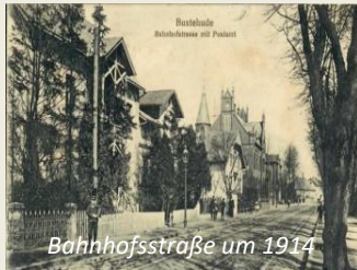
Bahnhofstraße um 1914

Stadtführung durch die wechselvolle Geschichte Buxtehudes mit dem eh. Buxtehuder Stadtarchäologen Dr. Bernd Habermann. Seit 959 bestand an der Este die bäuerliche Siedlung Buochstaden, die später um ein Benediktinerinnenkloster erweitert wurde. Zwischen 1280 und 1285 ließ Erzbischof Giselbert von Bremen eine Stadtfestung im Moor errichten, die später den Namen