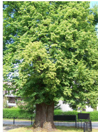
De ole Winterlinn.