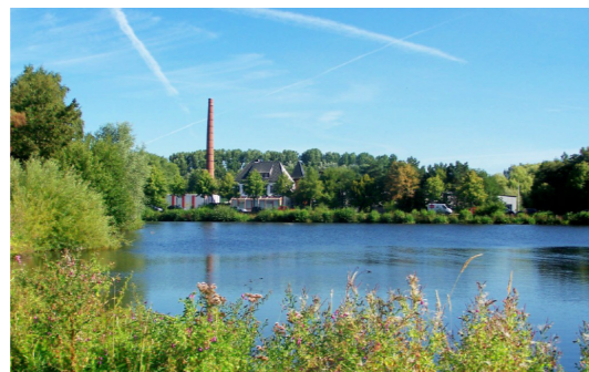
Estdamm un Möhlendiek.

3 Von den olen Boom geiht dat wieder in de Richt Messborger (Moisburger) Stroot. Dor loopt wi op den Est-Damm över de Est, de hier al freuher dörch den Damm to 'n Möhlendiek opstaut worrn is. Al in de Kloosterstiftungsurkunn von 1196 warrt twee Möhlen nöhmte. Een hett an