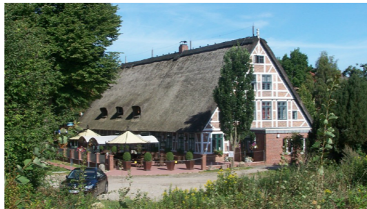
De „Lüneburger Schanze“.

4 An 't End von de Messborger Stroot kickt, inroht von mächtige Eken, de Giebel von een groot Reetdackhuus rut. Twee Restaurants sünd dor hüüt ünner een Dack. Freuher hett dat Gasthuus „Lüneburger Schanze“ heten. De Noom wies op dat Herzogdom Braunschweig-Lünborg, dat sik siet 1236 de Est as Grenz mit dat Erzbisdom Bremen delen dä. 1658/59 leut de tostännige Amtmann, de in Messborg seet, an de Stell een Wachthaus mit 'n Wall ümto boen, dormit he de Gegend no dat Ole Klooster hin, dat 1648 to Schweden kumen wörr, beter in 't Oog beholen kunn. Later is dat Wachthaus en Tollstatschoon worrn. In 't 18. Jahrhunnert leut de tomologe Besitter ut de Anloog een Buernhoff mit Kroog moken. De Bueree is al lang opgeven worrn, over de beiden Restaurants hebbt hüüt düchtig Toloop.