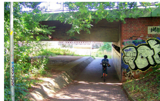
De Ünnerführen bi de „Spange“.

5 Een Spaazerweg bringt uns langs den Fobrikhoff un een Waterschutzrebeet weer trüch an de Est, de nu bit no de Oltstadt mitlöppt. Anners as de Kloosteroort, de langsam wossen is, is de hüütige Oltstadt dörch een Grünungsakt in de Welt kumen. De Bremer Erzbischof Giselbert von Brunkhorst leut se 1285 as „Ne'e Stadt“ in 't Moor twüschen Masch un Geest anleggen. Wenn wi nu den Weg an de Est lang goht, künt wi uns een genaue Vörstellung von den Abstand twüschen Kloosteroort un Oltstadt moken. De kommodige Weg langs de Est ward ünnerbroken von een Strootenünnerführung. Veer Weeg krüzt sik hier: De ole Waterstroot un de moderne Foot- un Radweg dorblangen ward överdweert von de 1881 anleggt lesenbohn-Streck un de 1987 inwieht „Spange“, een Stroot, de de Bohnschranken bi 'n Bohnhoff aflöst hett un den Strootenverkehr dörch een Ünnerführen in de Stadt lenken deit.