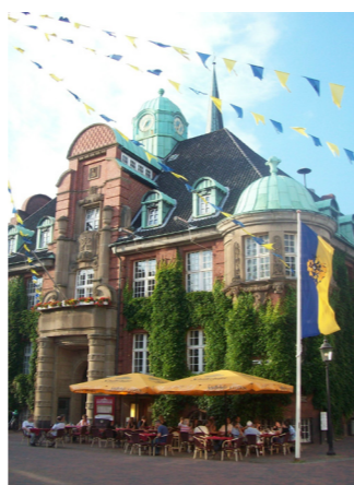
Dat ole Raathuus von 1913/14

fang bit in de Tiet von den Raathuusbo to sehn.