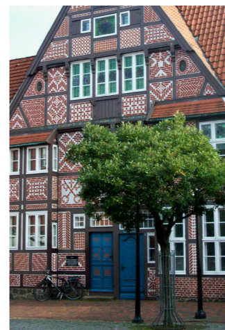
De smucke Fachwarksiet von dat Heimatmuseum.

12 Een smool Stroot geiht von 'n St.-Petri-Platz in den Stavenort. De Noom – 1575 to 'n eersten Mol nöhmte – kummt von dat Woort „Boodstuuw“ (= staven), de dat in disse Eck (= ort) geven hett. Noch in de eerste Hälft von dat 20. Jahrhunnert wörr dat hier een Viddel mit inge Gassen, wo in Mietshüüs ut 't 17. bit 19. Jahrhunnert mehrstendeels Arbeiterfamilien leven dän. In de 1920er Johren füng de Stadt dormit an, Hüüs optoköpen, üm dat Viddel to sanieren. Over dorünner verstünn 'n tomols to Hauptsook dat Afrieten von de olen un bofälligen Hüüs. In 'n Rohmen von de Oltstadtsanierung, de in de 1980er Johren